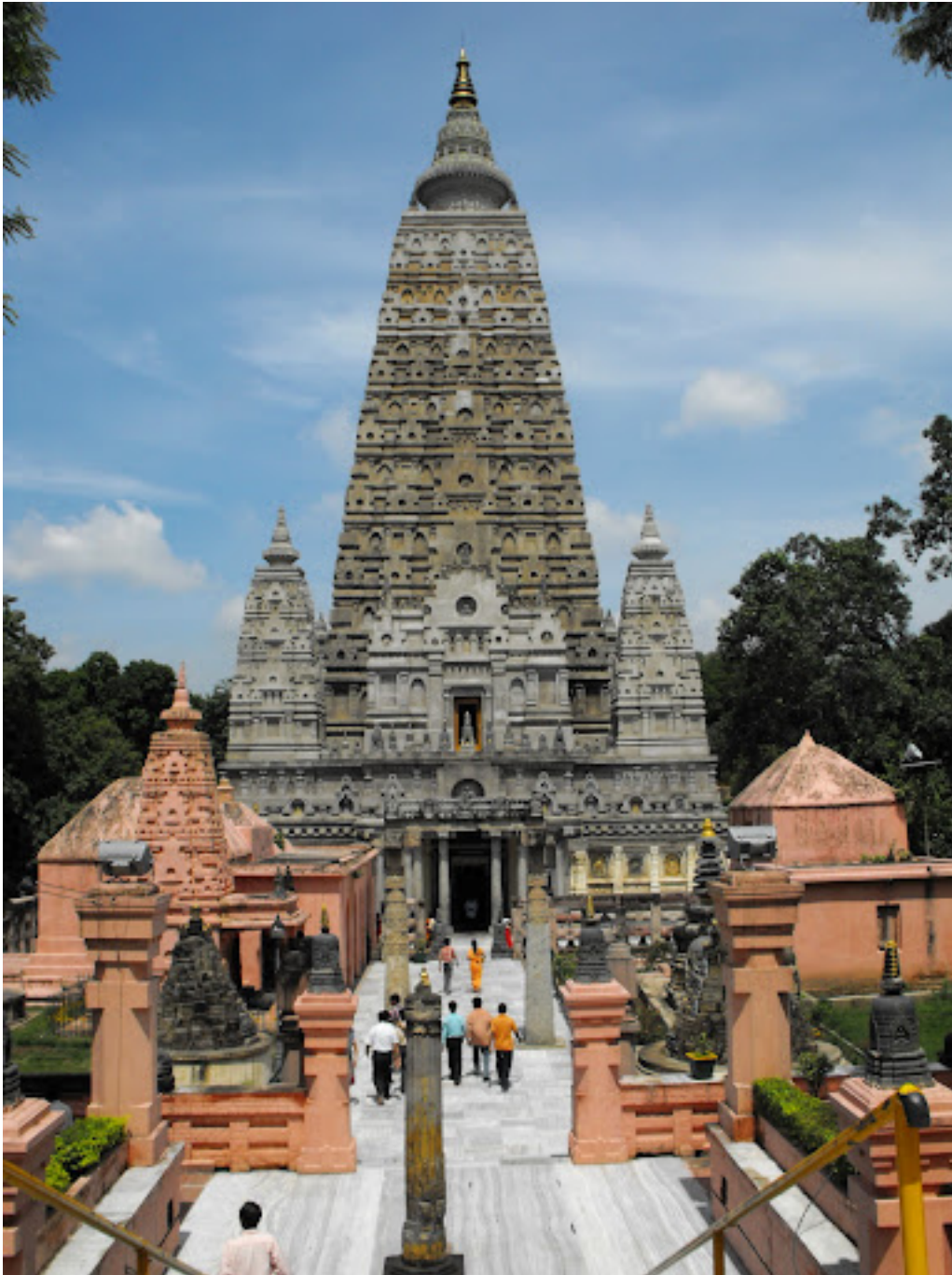
Archaeological remains of Phuket and Bodhgaya :